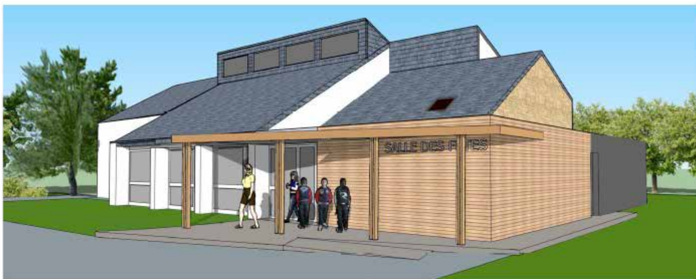
VUE SUR L'ENTREE