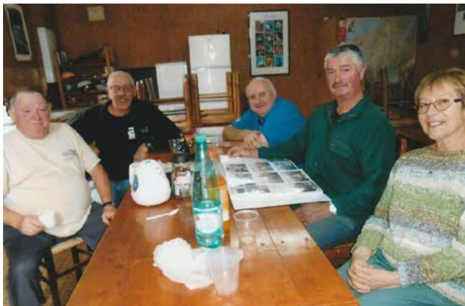
Les bénévoles au mois d'août après le démontage du auvent de la caravane

L'équipe des bénévoles Brandiviens accueille depuis 3 ans des familles au camping de Mme Sylvie OLLIVIER à Pluvigner.