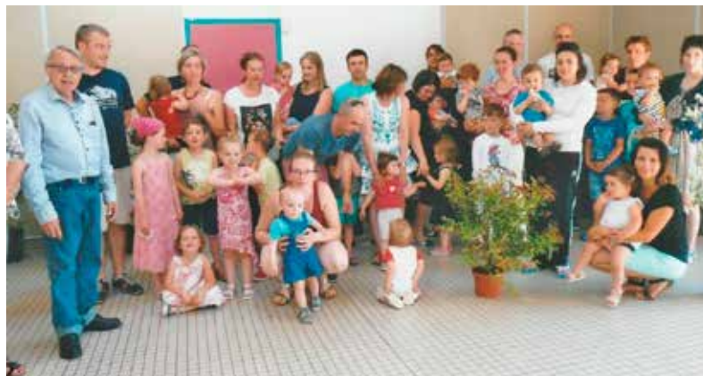
Mr. le Maire avec les bébés et leurs parents.

Ce fut un moment fort sympathique qui se clôtura, comme il se doit, par un joyeux pot de l'amitié.